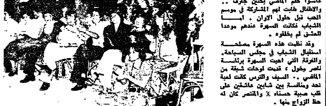
السهرة .. تقدمت كثيرا بالانقسام من الشبان والشابات تدريجيا على الى حفلات البكرة ، حيث تولى عدد رقص البكرة .